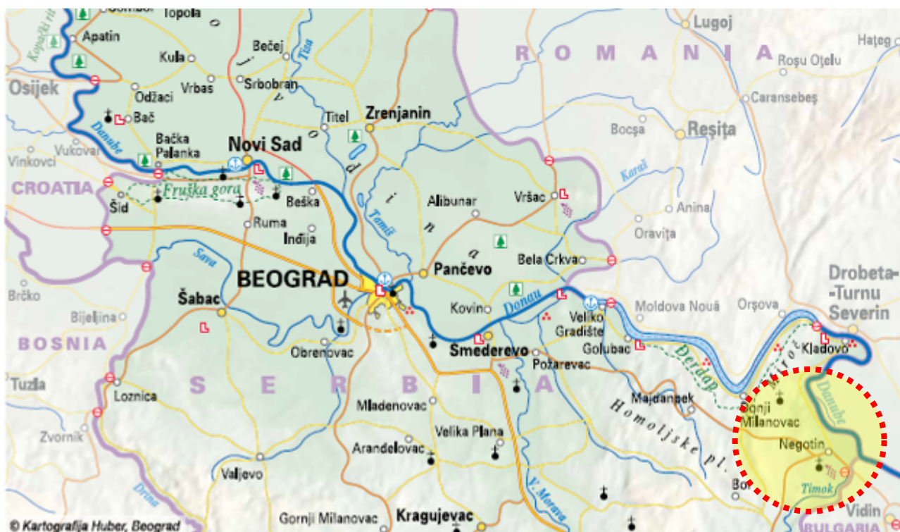
Slika 1: Područje reke Dunav

Reka Dunav izaziva značajne poplave u ovom području, što posebno pogađa opštinu Radujevac.