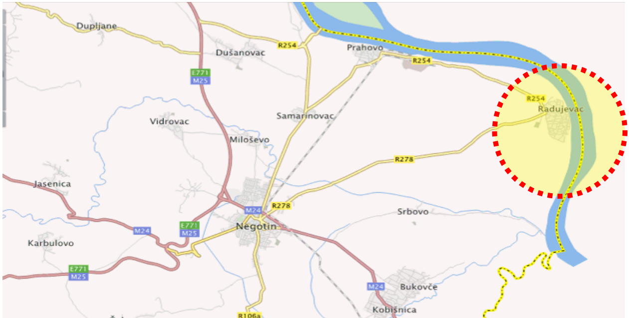
Slika 2: Lokacija opštine Radujevac

Predloženo je četiri vrste radova: Izgradnja konstrukcije za zaštitu od poplava – nasip dužine 2,7 km, rekonstrukcija slabih tačaka na nasipu, sanacija delova nasipa od dvadesetpetogodišnje do stogodišnje vode, ojačanje nasipa na lokacijama gde erozija rečnog korita može da dovede do pojave zaseka na nasipu.